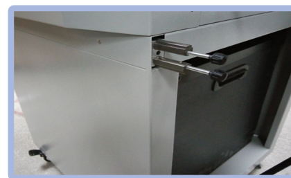
Herramientas y Papelera