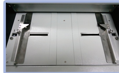
Bancada de registro central con ajuste de inclinación